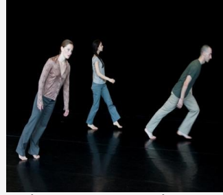
יצירה פילוסופית-רוחנית-אינטלקטואלית

ליצירה 'Sideways Rain' יש אפקט שבין היפנוזה למדיטציה. הצפייה בה מביאה לשחרור מן המחשבה המודעת ומאפשרת למחשבות לצוף, לצוץ ולהיעלם. התחושות מתחברות עם המראה הויזואלי, והמחשבה לא נאבקת לסדר אותן במבנה אלא מניחה להיגיון ומאמצת זרימה במקומו. אין בציפה המדומה הזאת ניתוק אלא ריחוף רק מעט מעל לפני השטח, מרחק שיוצר עדינות מחשבתית.