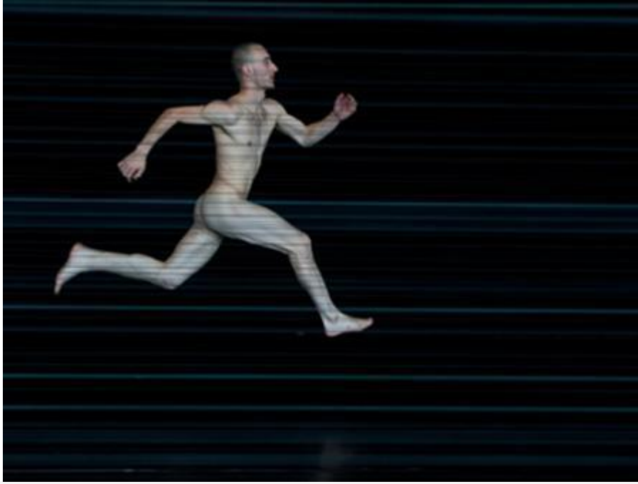
הדחף לתנועה האנושית