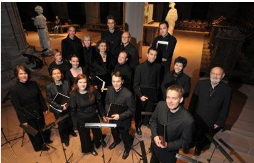
מקהלת המדריגל. יופיעו עם הקאמרטה הישראלית

"לא הייתי מגדיר את להקת בת שבע כמיינסטרים. הם תמיד מפתיעים אותי מחדש. יש שם משהו שמצית בכך מחשבה. זה נכון שאני לא משתגע על מיינסטרים וזו הסיבה שרבות מההצגות שהראו לי בישראל היה לי קשה מאוד לסבול. ברוב ההצגות ראיתי אלמנט חוזר שמבקש להציג תמונה שלמה ויפה, מעגל שלם שלעולם לא נוגע בקרקע, כמו תמונה. הם מבדרים אותך, מוכרים לך יופי ואסתטיקה, חיים במעגל סגור. יש יצירות חזקות כמו 'אשכבה' של חנוך לוין, שהיא בעיני יצירת מופת ומסיבות טכניות לא הצלחתי להביא לשוויץ. לגבי בלט ציריך, מדובר בהפקה שממילא הוזמנה להופיע בישראל והחלטנו לחבר אותה לפסטיבל".