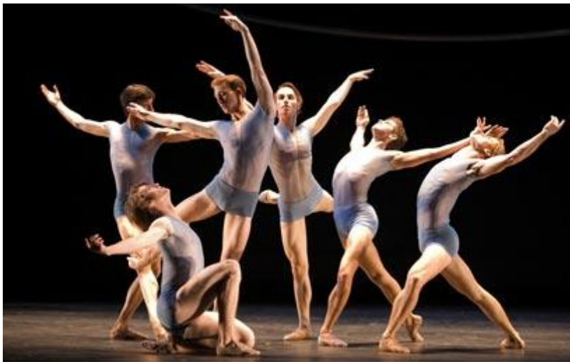
בלט ציריך. ארבעה מופעים בישראל

לדברי קויימן, שייסד את הפסטיבל בדיוק לפני עשור, מה שמניע אותו הוא חיפוש מתמיד אחר הקטבים שביניהם נוצרת תרבות. "בכל פסטיבל אני מחפש את השורש", הוא אומר. "ייתכן שבכל מדינה השורש שונה והניסיון של הפסטיבל הוא לזקק את התוצאה כדי להגיע לליבה ולהציג אותה. אנחנו לא מביאים את שוויץ לישראל או את ישראל לשוויץ, אלא את הפילטרים שדרכם התרבויות השוויצרית והישראלית עוברות".